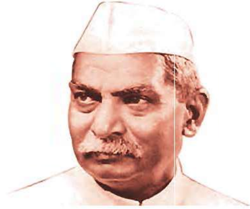
டாக்டர். பாபு இராஜேந்திர பிரசாத்

அரசியலமைப்பு நிர்ணய சபை 1950 சனவரி 24ம் நாள் கடைசியாக கூடியது. 1950 சனவரி 26-ஆம் நாளில் நமது அரசியலமைப்புச் சட்டம் நடைமுறைப்படுத்தப்பட்டது. அந்நாளையே நாம் குடியரசு நாளாகக் கொண்டாடுகிறோம்.