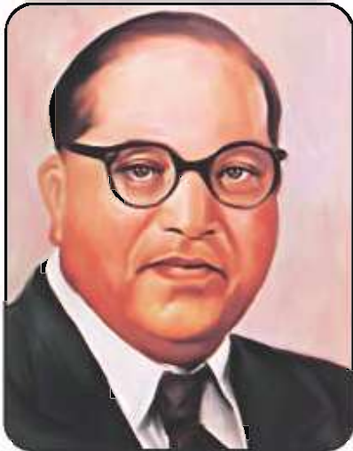
டாக்டர். பி.ஆர். அம்பேத்கர்

அரசியலமைப்புச் சட்டம் இயற்றும் பணி 2 ஆண்டுகள் 11 மாதங்கள் 18 நாட்கள் நடைபெற்றது. 11 திட்டமிட்டக் கூட்டங்களில் அரசியலமைப்புச் சட்டத்தைப் பற்றி கலந்துரையாட 114 நாட்கள் ஆயிற்று.