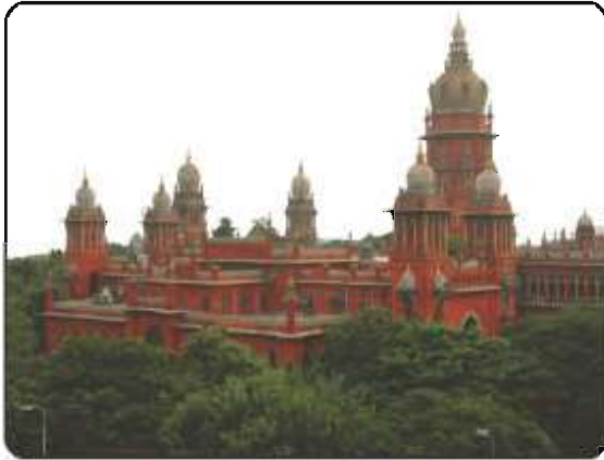
உயர் நீதிமன்றம், சென்னை