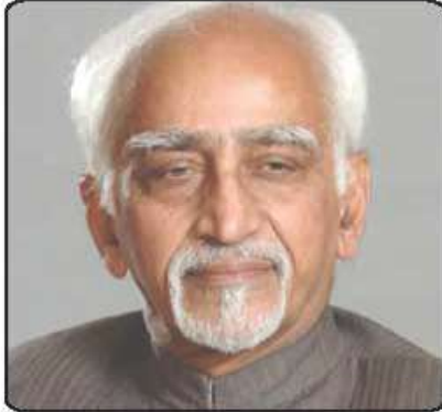
குடியரசுத் துணைத்தலைவர் திரு. முகமது ஹமீது அன்சாரி

குடியரசுத் தலைவராவதற்குரிய தகுதிகள் அனைத்தும் குடியரசுத் துணைத் தலைவர் ஆவதற்கு இருக்க வேண்டும்.