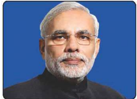
பிரதம மந்திரி திரு. நரேந்திர மோடி