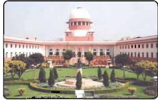
உச்ச நீதிமன்றம், புது டெல்லி

உச்ச நீதிமன்றத்தைத் தலையாய நீதிமன்றமாகக் கொண்ட சுதந்திரமான, ஒருங்கிணைக்கப்பட்ட நீதித்துறை ஒன்றினை நமது அரசியலமைப்பு ஏற்படுத்தியுள்ளது. இந்த நீதித்துறை மத்திய, மாநில அரசுகளின் சட்டம் மற்றும் நிருவாகப்பிரிவுகளின் தலையீடுகளில்லாமல் சுதந்தரமாக இயங்குவதாகும். ஒருங்கிணைக்கப்பட்ட நீதித்துறை என்பது நாடு முழுவதும் பல அடுக்குகளிலுள்ள நீதிமன்றங்கள் அனைத்தும் ஒரே அமைப்பின் கீழ் செயல்படுவது என்று பொருள்படும். குடிமக்களின் உரிமைகளையும் சுதந்திரத்தையும் பாதுகாப்பதில் நீதித்துறை முக்கிய பங்கு வகிக்கிறது. அது மட்டுமன்றி, அரசியலமைப்பு விதிகளை விளக்குவதிலும், நிருவாக, சட்டமன்றத் தலையீடுகளிலிருந்து அரசியலமைப்பின் அடிப்படைக் கட்டமைப்பைப் பாதுகாப்பதிலும், நீதித்துறை முக்கிய பங்காற்றுகிறது.