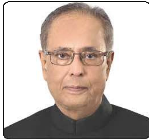
குடியரசுத் தலைவர் திரு. பிரணாப் முகர்ஜி

இந்திய அரசியலமைப்பின்படி, குடியரசுத் தலைவர், இந்தியக் குடியரசின் தலைவராகவும், இந்திய ஒன்றியத்தின் (யூனியன்) நிருவாகத் தலைவராகவும் விளங்குகிறார். மேலும் நீதித்துறைக்கும் பொறுப்புடையவராவார். 53 ஆவது அரசியலமைப்புச் சட்டத்தின்படி, மத்திய அரசாங்கத்தின் அதிகாரங்கள் அனைத்தும் குடியரசுத் தலைவரிடமே உள்ளன. இவ்வதிகாரங்களை இவர் நேரிடையாகவோ அவர் கீழ் இயங்கும் அலுவலர்கள் மூலமாகவோ செயல்படுத்தலாம்.