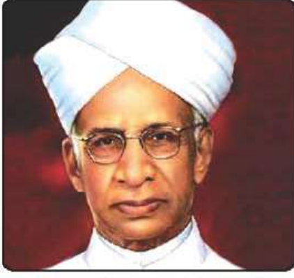
இந்தியாவின் முதல் குடியரசுத் துணைத்தலைவர் டாக்டர். எஸ். இராதா கிருஷ்ணன்

குடியரசுத் தலைவர் உடல் நலக் குறைவால் தனது கடமைகளை ஆற்ற இயலாத போதும், அல்லது நாட்டில் இல்லாத போதும் குடியரசு துணைத் தலைவர், குடியரசுத் தலைவரின் பணிகளை மேற்கொள்வார். குடியரசுத் தலைவர் பதவி விலகினால், இறப்பு அல்லது குற்றச்சாட்டு மூலம் பதவி காலியாகும் போதும் அவரது பணிகளைக் குடியரசு துணைத் தலைவர் மேற்கொள்வார்.