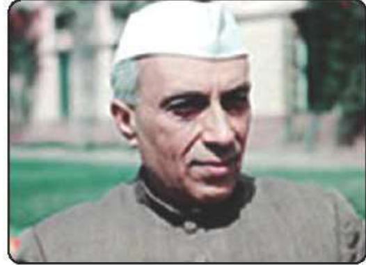
இந்தியாவின் முதல் பிரதம மந்திரி திரு. ஜவஹர்லால் நேரு

இங்கிலாந்து நாட்டு முறையைப் பின்பற்றி, இந்திய அரசியலமைப்புச் சட்டம் பிரதம அமைச்சரின் தலைமையிலான நிர்வாக அமைப்பைத் தந்துள்ளது. இந்திய அரசியலமைப்புச் சட்டத்தின் படி மக்களவையில் பெரும்பான்மை பெற்றுள்ள கட்சித் தலைவரைப் பிரதம அமைச்சராகக் குடியரசுத் தலைவர் நியமனம் செய்கிறார். பிரதமரின் ஆலோசனையின் பேரில் அவரது அமைச்சரவை நியமனம் செய்யப்படுகிறது. பிரதம அமைச்சரே அமைச்சரவையின் தலைவராகச்