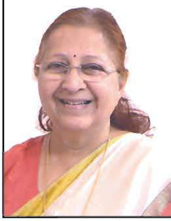
சபாநாயகர் திருமதி சுமித்ரா மகாஜன்

சபாநாயகர் இல்லாத காலங்களில் மக்களவையால் தேர்ந்தெடுக்கப்பட்ட துணை சபாநாயகர் அவையை நடத்துவார்.