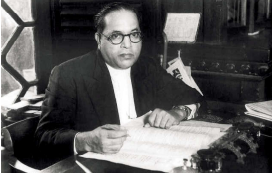
Dr. B.R. அம்பேத்கர்

இந்திய அரசியலமைப்புச் சட்டம் உருவாக்கப்பட்டது. எனவே அவர் "இந்திய அரசியலமைப்பின் தந்தை" என அறியப்படுகிறார்.