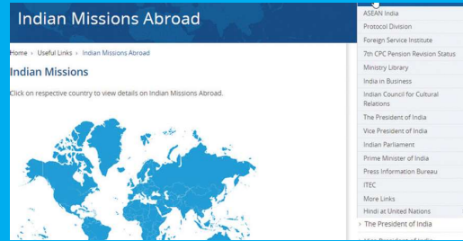
படி - 2