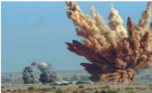
முதல் அணு சோதனை-பொக்ரான் (ராஜஸ்தான்)

இந்தியா அணிசேரா இயக்கத்தில் இருந்த போதும் சோவியத் யூனியனுடன் 1971ஆம் ஆண்டில் இந்திய - சோவியத் ஒப்பந்தத்தின் (20 ஆண்டு கால ஒப்பந்தமான அமைதி, நட்புறவு மற்றும் ஒத்துழைப்பு) மூலம் இணைந்தது. பின்னர் இந்தியா ராணுவ நவீனமயமாக்கலை மேற்கொண்டது. சீனா 1964ஆம் ஆண்டு லாப் நார் (Lop Nor) என்னுமிடத்தில் மேற்கொண்ட அணு சோதனைக்குப் பதிலடியாக இந்தியா தனது முதல் பூமிக்கடியிலான அணு சோதனைத் திட்டத்தினை 1974இல் நடத்தியது. (நிலத்தடி அணு வெடிப்புத் திட்டம் / Subterranean Nuclear Explosions Project)