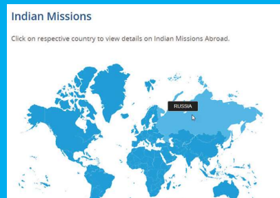
படி - 3