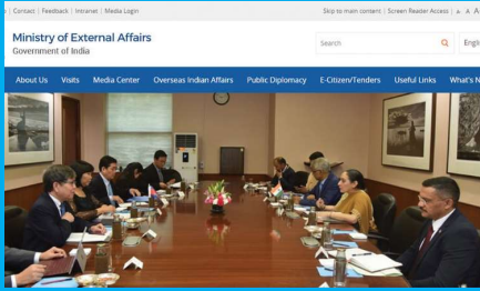
படி - 1