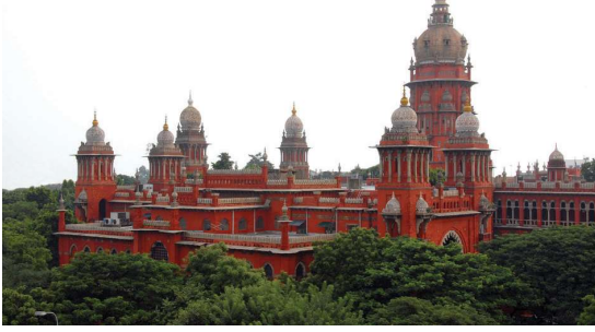
சென்னை உயர் நீதிமன்றம்

இந்தியாவின் ஒவ்வொரு மாகாணமும் ஓர் உயர் நீதிமன்றத்தைக் கொண்டிருந்தது. 1950-க்குப் பிறகு தோற்றுவிக்கப்பட்ட உயர் நீதிமன்றங்கள் அண்டை மாநிலங்களுக்கும் உயர் நீதிமன்றமாக விளங்கியது. மாநில அளவில் உயர் நீதிமன்றங்களே மிக உயர்ந்த நீதிமன்றங்களாகும். இருப்பினும் உச்ச நீதிமன்றத்தின் வழிகாட்டுதல்கள் மற்றும் மேற்பார்வையின் கீழ் உயர் நீதிமன்றங்கள் செயல்படுகின்றன.