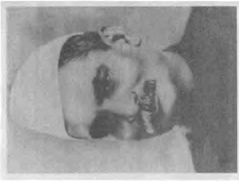
டாக்டர் இராஜேந்திர பிரசாத் (1884-1953) காந்தியவாதி சுதந்திர இந்தியாவின் முதல் குடியரசுத் தலைவர். பதவி வகித்த காலம் (1950-62) 1962 ம் ஆண்டு பாரத் ரத்னா விருது பெற்றவர்.