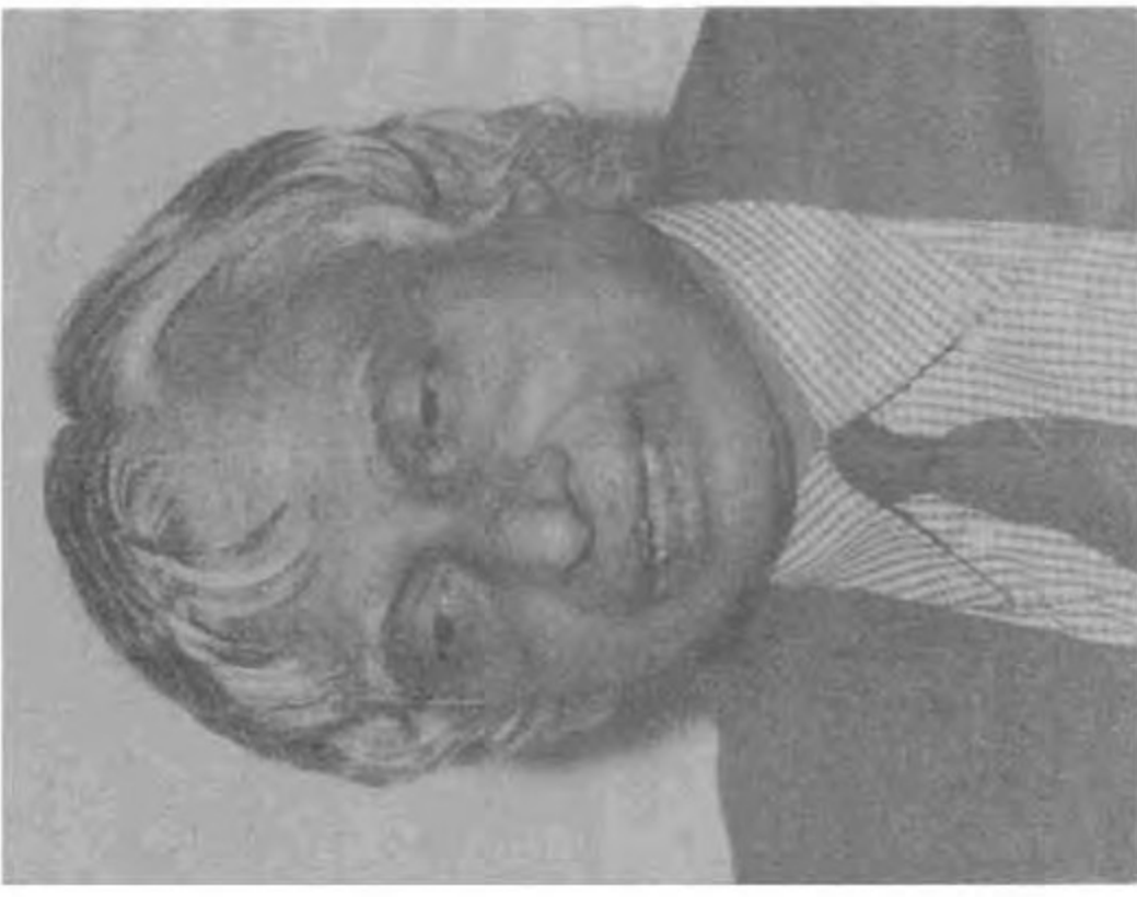
13. திரு. டாக்டர். எ.பி.ஜே.அப்துல் கலாம் 299