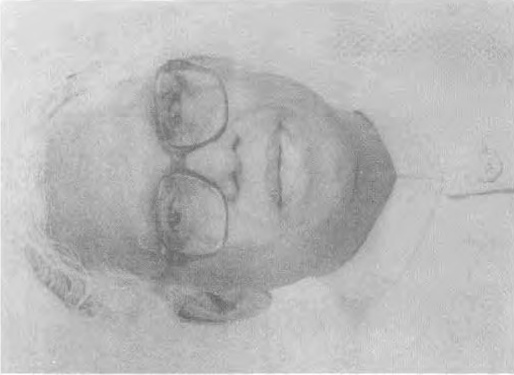
12. கே.ஆர்.நாராயணன் (பிறந்தது 1921 ஜூலை 1997ல் குடியரசுத் தலைவர் பதவி பொறுப்பேற்றார். துணைக்குடியரசுத் தலைவர் (1992-97) லண்டன், பொருளியல் பட்டம் பெற்று இந்திய வெளி உறவு பணித்துறையில் சேர்ந்தார். அரசியல் ஞானி மற்றும் கல்வியாளர் அயல்நாட்டு தூதுவர் ஆக சீனா-அமெரிக்காவில் பணியாற்றினார் கல்வியாளர்.