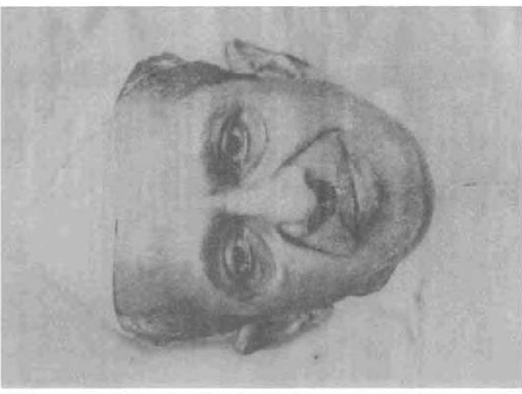
7. பி.டி.ஜாட்டி (பிறந்தது 1912) துணைக்குடியரசுத் தலைவர் (1974-79) குடியரசுத் தலைவர் (பொறுப்பு) - (பிப்ரவரி-ஜூலை 1977) முதல் அமைச்சர் மைசூர் மற்றும் ஆளுநர் ஒரிஸ்ஸா