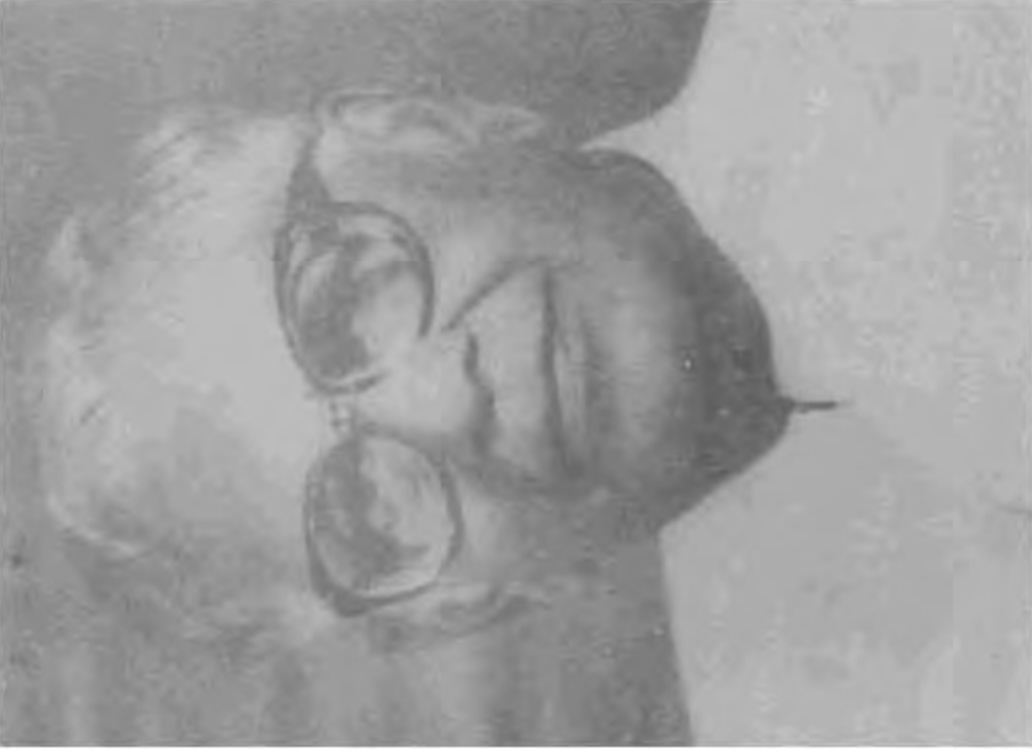
10. ஆர்.வெங்கட்ராமன் (பிறந்தது 1910) குடியரசுத்தலைவர் (1987-92). துணைக்குடியரசுத்தலைவர் (1984-87) தொழிற்சங்கவாதி பரதுகாப்பு மற்றும் நிதித்துறை காபினெட் அமைச்சர் ஆக பணியாற்றியவர்.