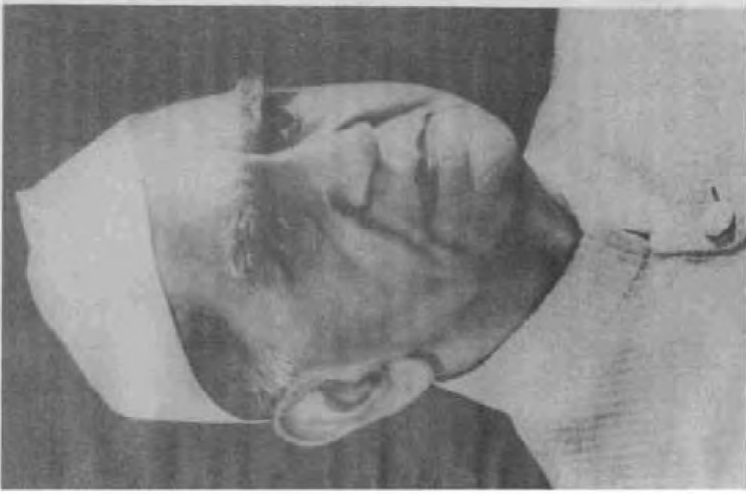
6. பக்ருதீன் அலி அகமது (1905-77) ஐந்தாவது குடியரசுத்தலைவர் (1974-77) இந்திய சுதந்திர போராட்டத்தில் முக்கிய பங்கு வகித்தவர்.