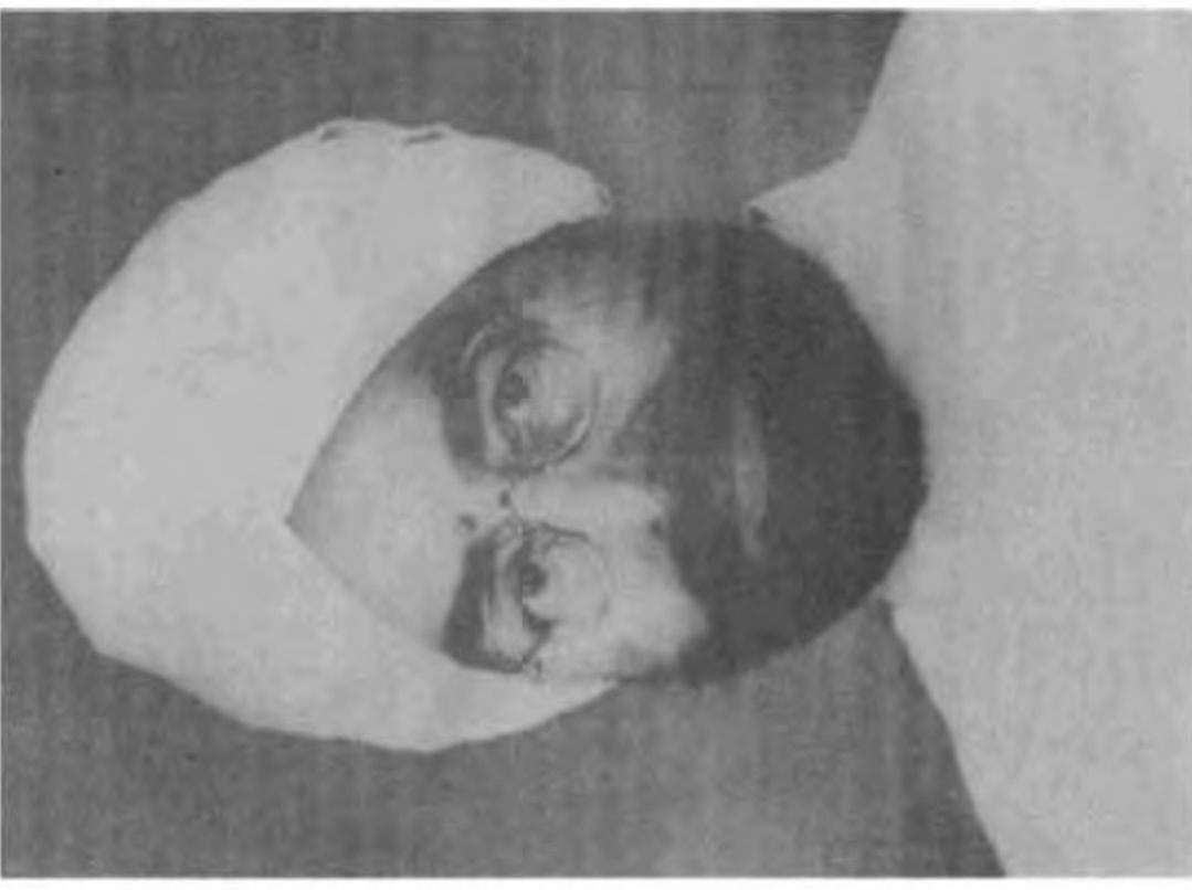
9. கியாணி ஜெயில் சிங் (1916-94) குடியரசுத் தலைவர் (1982-87) சுதந்திர போராட்ட வீரர். முதல் அமைச்சர் பஞ்சாப்.