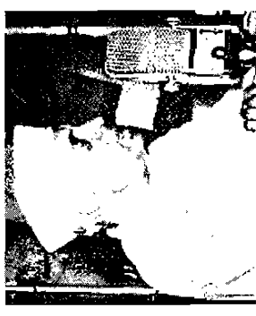
பன்டித ஜவஹர்லால் நேரு (1889-1964)

ஜவஹர்லால் நேரு நவீன இந்தியாவின் சிறப்பியாக கருதப்படுகிறார். 'உலக வரலாற்றின் சுருக்கங்கள்' மற்றும் 'இந்தியாவின் கண்டுபிடிப்பு' போன்ற அவரின் சில புத்தகங்களில், சுதந்திர இந்தியா மற்றும் பலமான தேசத்தை உருவாக்குவதற்கு அவரின் கொள்கைகளும் திட்டங்களும் காணப்படுகின்றன. சுதந்திர இந்தியாவின் முதல் பிரதம மந்திரியாக, விவசாயம் மற்றும் தொழில் களங்களில் தன்னிறைவு நாடாக்குவதற்கு தேவையான திட்டங்களையும் திட்ட அமைப்புகளையும், இராஜேந்திரப்பிரசாத்,