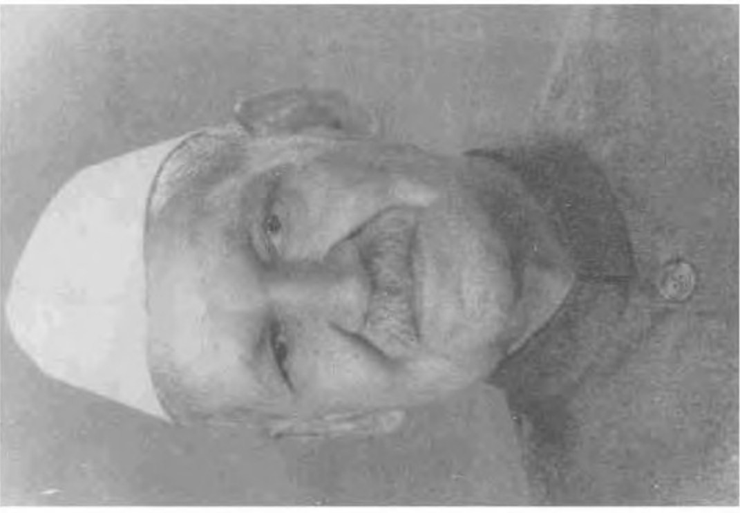
11. டாக்டர். சங்கர் தயாள் சர்மா (பிறந்தது 1919) அறிஞர். கந்திரி. போராட்ட வீரர். குடியரசுத் தலைவர் (1992-97) துணைக் குடியரசுத் தலைவர் (1987-92)