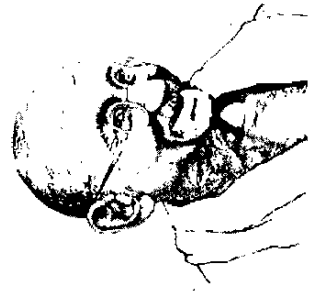
மகாத்மா காந்தி (1869-1948)