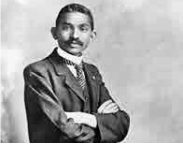
தென் ஆப்பிரிக்காவில் காந்தி

இந்த நிகழ்வினைப் பற்றி நீங்கள் என்ன நினைக்கிறீர்கள்? முதல் வகுப்புப் பெட்டியில் பயணம் செய்ய அவருக்கு உரிமை உண்டு என எண்ணுகிறீர்களா?