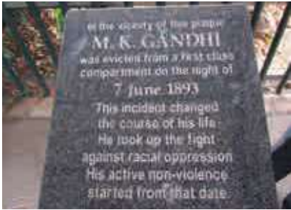
பீட்டர்மரிட்ஸ்பேர்க் இரயில்வண்டி நிலையத்தில் அமைக்கப்பட்டுள்ள நினைவுக் கல்வெட்டு

ஒரு மனிதராக, முதல் வகுப்புப் பெட்டியில் பயணம் செய்ய காந்திக்கு எல்லா உரிமைகளும் இருந்தன. ஆனால், அவரைப் பாகுபடுத்திக் காட்டியது அவரது நிறமே. மக்கள் நிறத்தால் மட்டுமின்றி, இனம், பாலினம், பிறந்த நாடு, சாதி மற்றும் மதம் போன்றவற்றின் அடிப்படையிலும் பாகுபடுத்தப்படுகின்றனர்.