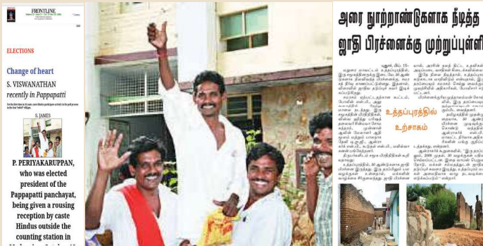
ஜனநாயகத்தின் எழுச்சி மனிதத்தன்மையற்ற சுவரின் வீழ்ச்சி

மேலும் இந்தியாவின் மக்கள்தொகையில் 8.6 சதவிகிதம் பழங்குடியின மக்கள் உள்ளனர். இவர்கள் தொடர்ந்து அவர்களுக்கே உரிய பழக்க வழக்கங்களோடு வாழ்வதோடு மட்டும் அல்லாமல் பல நேரங்களில் உலகின் பிற பகுதி மக்கள் அவர்களை எளிதில் அணுக முடியாத நிலையிலும் வாழ்கின்றனர். இதுவே அவர்களைப் பாதுகாப்பதற்கானச் சட்டங்கள் இயற்றப்படுவதற்கான அடித்தளமாக அமைந்துள்ளது.