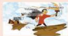
பூடானில் ஏற்பட்ட வரலாற்று மாற்றம்

நன்றி: தி இந்து – 3.11.2008 கேலிச்சித்திரம்: கேஷுவ்