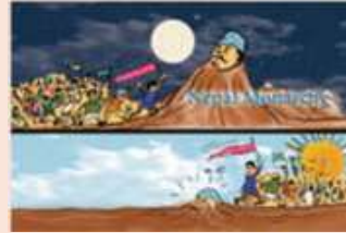
இரு கேலிச்சித்திரங்களின் கதை

நன்றி: தி இந்து – 31.12.2007 கேலிச்சித்திரம்: சுரேந்திரா