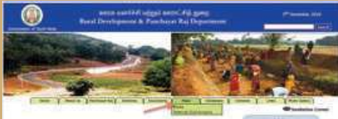
படி - 2