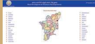
படி - 3