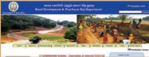
படி - 1