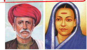
ஜோதிபா பூலே சாவித்திரி பூலே

இதுவரை விவாதிக்கப்பட்ட இயக்கங்கள் பெரும்பாலும் மேல்சாதியாகக் கருதப்பட்ட சமூகங்களின் மேல் அதிக கவனம் செலுத்தின. ஆனால் சில குறிப்பிட்ட இயக்கங்கள் ஒடுக்கப்பட்ட சமூகங்களை அணிதிரட்டி அவர்களிடம் தங்கள் கொள்கைகளை விளக்கின. அவற்றுள் மிக முக்கியமான இயக்கம் ஜோதிபா பூலேயின் சத்ய சோதக் சமூகமாகும்.