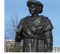
ராஜா ராம்மோகன் ராய்

பிரெஞ்சுப் புரட்சியின் கோட்பாடுகளால் ஈர்க்கப்பட்டு ஐரோப்பா சென்ற ராஜா ராம்மோகன் ராய் பிரிட்டல் நகரில் மரணத்தைத் தழுவினார். தக்க சமயத்தில் தேவேந்திரநாத் தாகூர் (ரவீந்திரநாத் தாகூரின் தந்தையார்) புத்தியூர் ஊட்டாமல் இருந்திருந்தால் இவ்வியக்கம் விரைவாக வீழ்ந்திருக்கும். அவருக்குப்பின் 1857 முதல் கேசவ் சந்திர சென் இயக்கத்தை முன்னெடுத்துச் சென்றார். இவ்வமைப்பின் வலுவை 1865இல் அது பெற்றிருந்த 54 கிளைகளின் எண்ணிக்கையிலிருந்து தெரிந்து கொள்ளலாம். (வங்காளத்தில் 50 கிளைகள்,