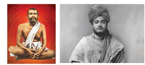
இராமகிருஷ்ண பரம்ஹம்சர் விவேகானந்தர்

கண்டோம். அதன் கொள்கையாக வங்காளத்தில் இராமகிருஷ்ண பரம்ஹம்சரின் நினைவாக இராமகிருஷ்ண கிஷன் உதயமானது. இராமகிருஷ்ண பரம்ஹம்சர் கல்கத்தாவின் அருகேயுள்ள தட்சிணேஸ்வர் எனும் ஊரிலுள்ள கோவிலின் ஏழைப் பூசாரி ஆவார். அவர் முறையான கல்வி கற்றவரில்லை. ஆனால் தீவிர ஆன்மீக வாழ்வை மேற்கொண்டவர். அனைத்து மதங்களிலும் இயல்பாக உள்ள உண்மைகள் மீது ஆழமான நம்பிக்கை கொண்டிருந்தார். பல்வேறு மதங்களின் நடைமுறைகளுக்கு ஏற்றவாறு சமயப் பணிகளை மேற்கொண்டு அம்மதங்கள் சார்ந்த நம்பிக்கைகளைச் சேர்த்துப் பார்த்தார். அவரைப் பொருத்த அளவில் "அனைத்து மதக் கருத்துக்களும் ஒரு இலக்கைச் சென்றடையும் பல்வேறு பாதைகள் என்பதாகும். இராமகிருஷ்ணருடைய பரந்த பார்வையும், இறைநிலை சார்ந்த உள்ளுணர்வும், ஆன்மீகப் பெருவிருப்பமும் பெருவாரியான மக்களைக் கவர்ந்தன. தன் கருத்துகளை கதைகள் மற்றும் விபக்கத்தக்க உவமைகள் மூலமாக விளக்கினார். அவர்மேல் விடப்பட்ட ஒருவர் இவ்வயனைத்தையும் 'இராமகிருஷ்ண காதாபிர்தா' எனும் தலைப்பில் தொகுத்தளித்துள்ளார்.