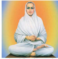
வள்ளலார் இராமலிங்க அடிகள்

11 22 திருமலர் திருமலர் 1867-1868 1867-1868 திருமலர் திருமலர்