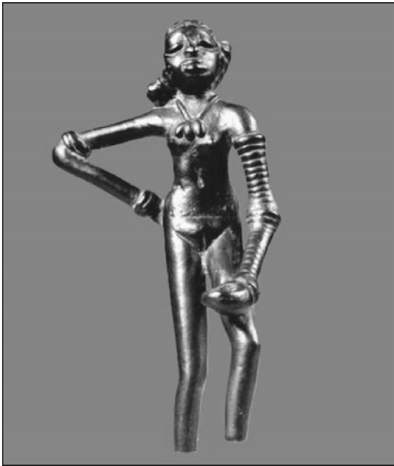
நடன மாதுவின் சிலை

சிந்துவெளி மக்கள் நுண்கலைகளில் சிறந்து விளங்கினர். இவர்கள் பயன்படுத்திய முத்திரைகளில் காணப்படும் உருவங்கள், பாணைகளில் வரையப்பட்டுள்ள ஓவியங்கள், சுடுமண் பொம்மைகள், அணிகலன்கள், விவண்கலத்தாலான நடனப்பெண்ணின் உருவம், யோகி சிற்பம் ஆகியவை சிந்துவெளி மக்களின் கலை ஆர்வத்தை வெளிப்படுத்தும் சான்றுகளாகத் திகழ்கின்றன.